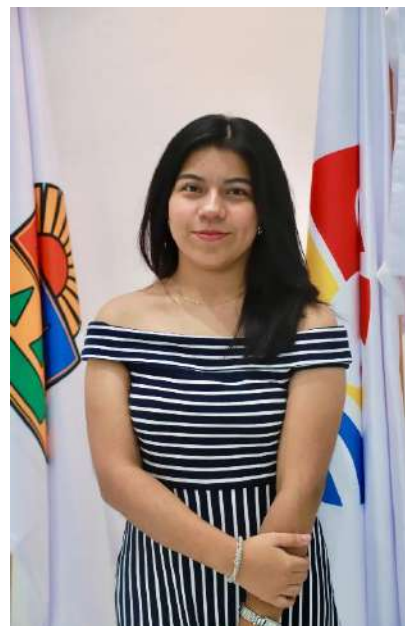
Estudiantes participantes de movilidad académica Internacional a través del programa ELAP 2026