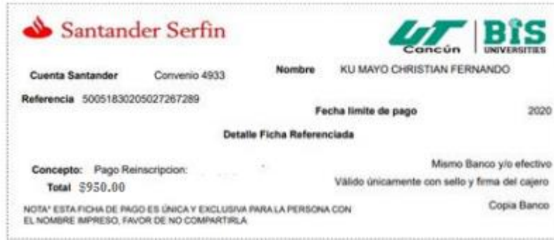
*Ejemplo de ficha de pago.